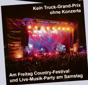
Am Freitag Country-Festival und Live-Musik-Party am Samstag

Abend am Freitag begeistert mit einer besonderen Jubiläumsbesetzung: Country-Star Tom Astor und die Kultband Truck Stop sorgen musikalisch für echtes Truck-Grand-Prix-Feeling.