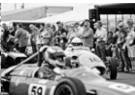
Festival für Klassik-Fans