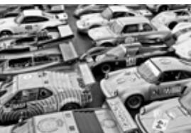
Stellfläche der legendären Rennwagen

Ob beim Abendrennen der 50er-Jahre-Sportwagen (Samstag), der Formula Junior „Lurani Trophy“ und Vintage Sports-car Trophy, den DTM- und DRM-Revival-Läufen oder den vielen anderen Highlights: Dieses Festival lässt die Besucher spüren, wie es „damals“ war. Auf der Bühne der Traditions-Strecke gibt es überall etwas zu entdecken. Hier schreiben Helden von einst Autogramme, dort sind legendäre Rennwagen zu bestaunen. Auf der Strecke lockt Rennaction, im Fahrerlager Fotomotive en masse: Herzlich willkommen im Paradies für Klassik-Fans!