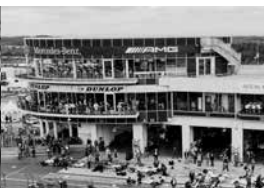
Historic Paddock Club: Das „gewisse Extra“

Familienfreundlich: Fahrerlagereintritt im Ticketpreis inbegriffen, freier Eintritt für Besucher bis 17 Jahre (in Begleitung eines Erwachsenen)