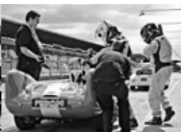
Historische Schätze im Renneinsatz