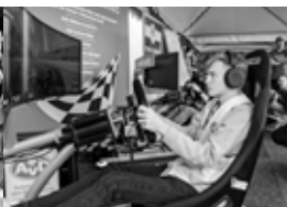
Action nicht nur auf der Straße