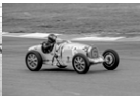
Historische Rennwagen im ureigenen Element